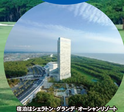
宿泊はシェラトン・グランデ・オーシャンリゾート